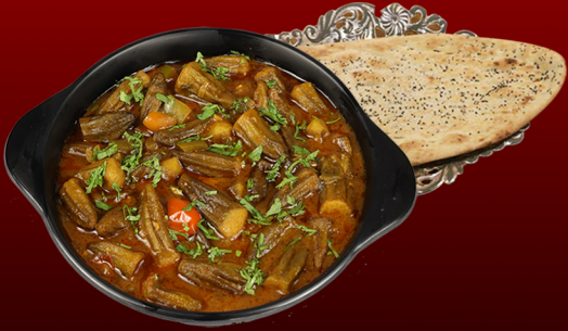
بامية Bamia-Okra 15.00