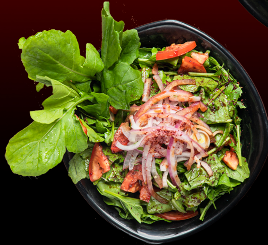
سلطة جرجير Rocca Salad 12.00