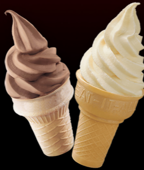
آيس كريم Ice Cream 3.00