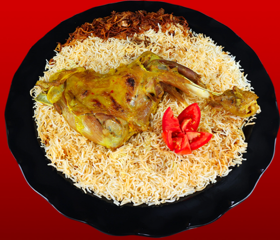
لحم حنيذ تعزي (كتف) Mutton Haneeth Taizy Shoulder 75.00 - 🌶️ 80.00