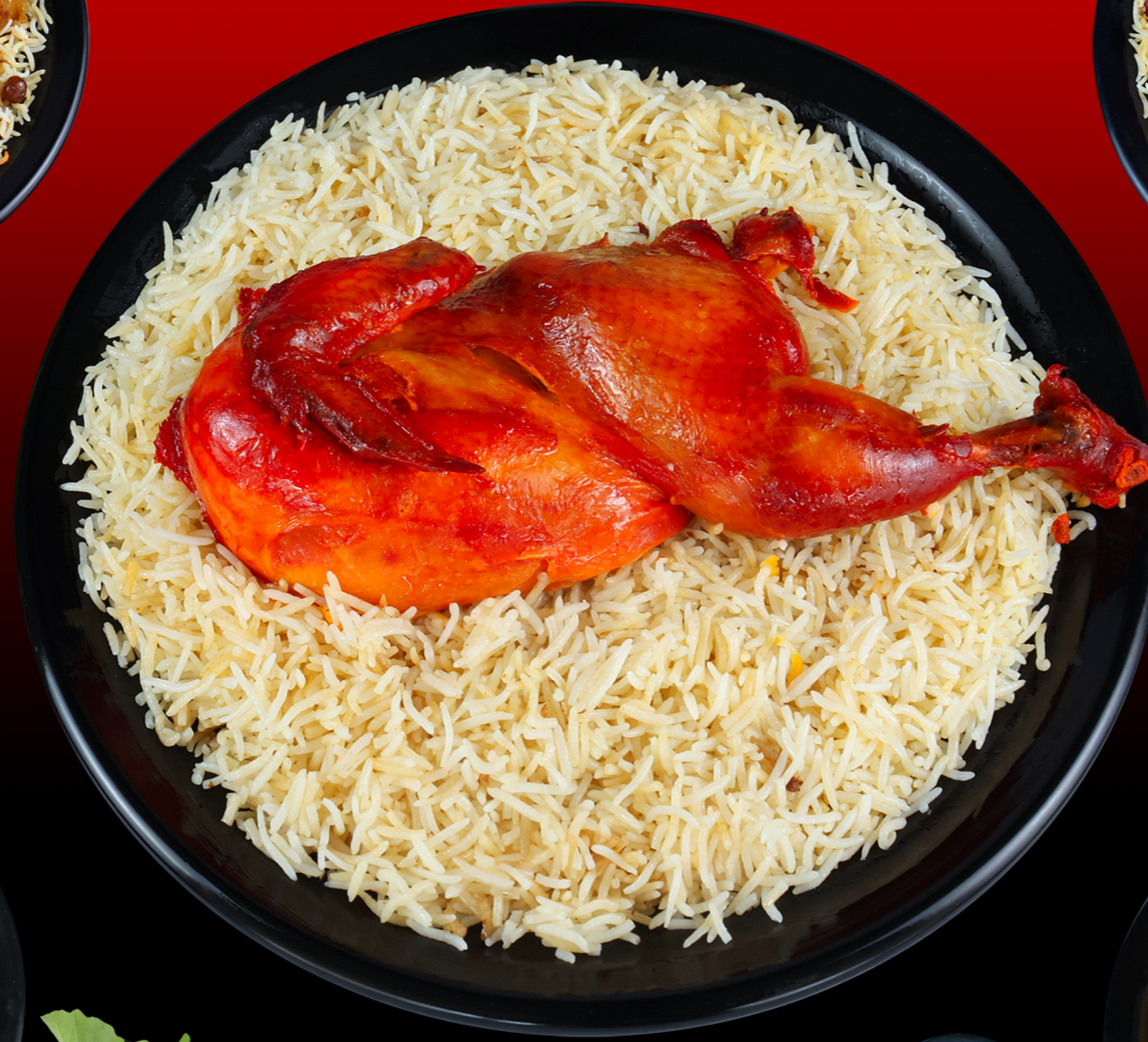
دجاج مندي 31.00 Chicken Mandi