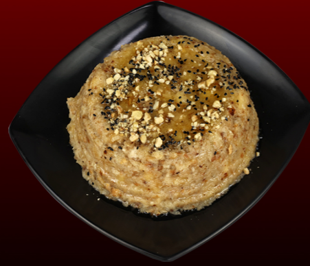
فتة تمر و موز Fatta Banana / Dates 20.00