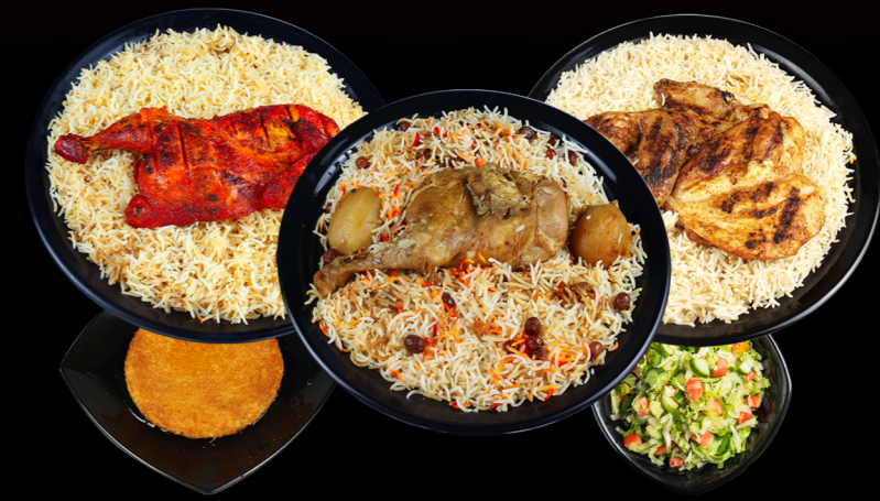
Chicken Sufra سفرة دجاج 99.00