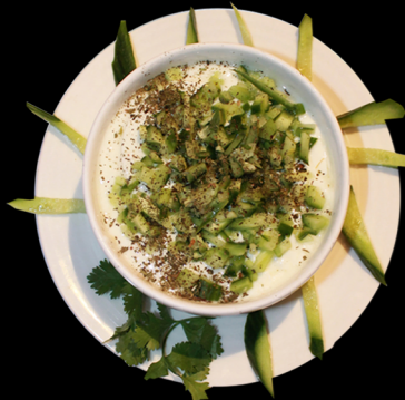
سلطة روب بالخيار Yogurt Salad 10.00