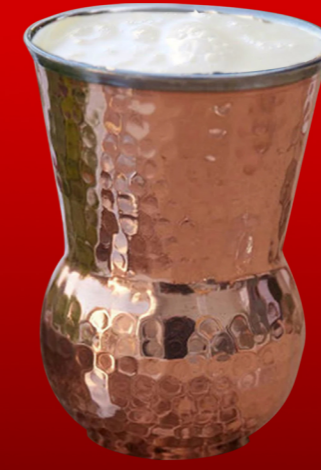
لسي حلو Sweet Lassi 12.00