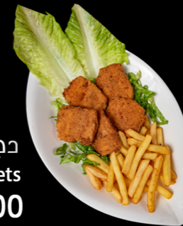
دجاج مسحب Chicken Nuggets 17.00