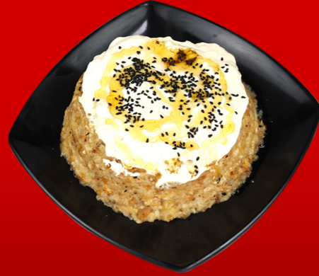
معصوب ملكي Masob Malaki 30.00