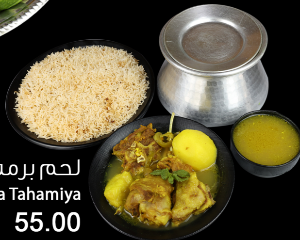
لحم برمه تهاميه Mutton Burma Tahamiya 55.00