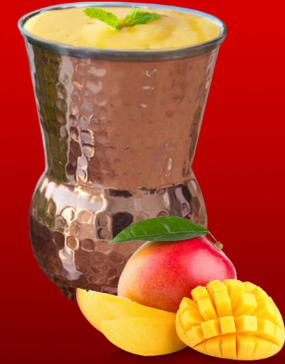
مانجو لسي Mango Lassi 12.00