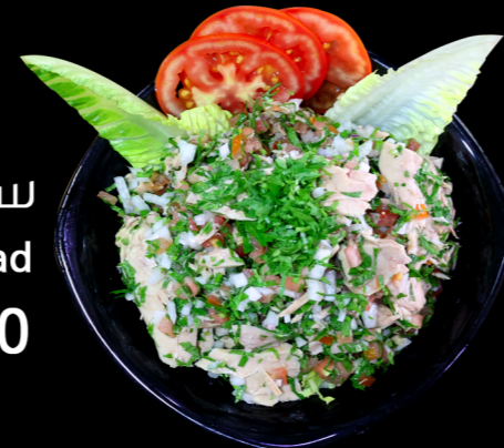
سلطة تونة Tuna Salad 15.00