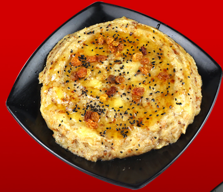
فتة موز Fatta Banana 20.00