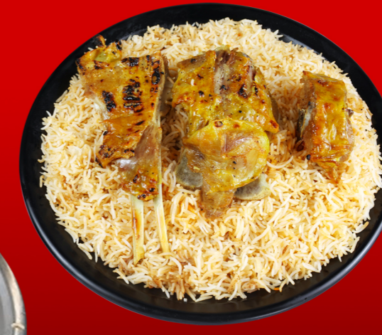
لحم مظبي Mutton Mazbi 62.00