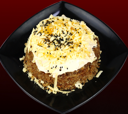
عريكة Areekah 30.00