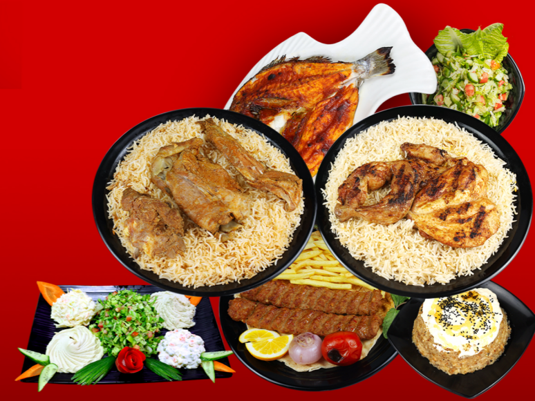
Mix Sufra سفرة مشكلة 170.00