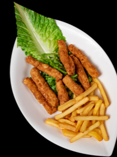
اصابع السمك Fish Fingers 17.00