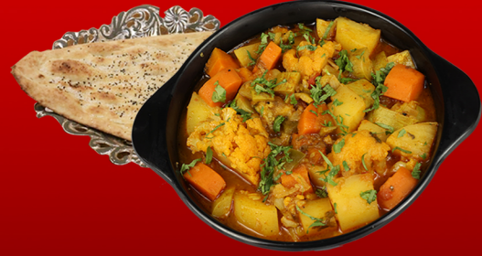
مشكل خضار Mix Vegetable 15.00