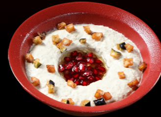
حمص Hummus 15.00