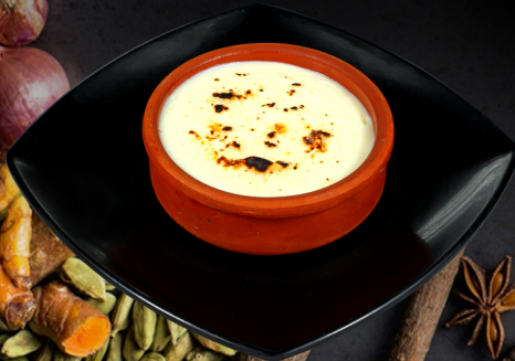
رز بالحليب Rice pudding 10.00