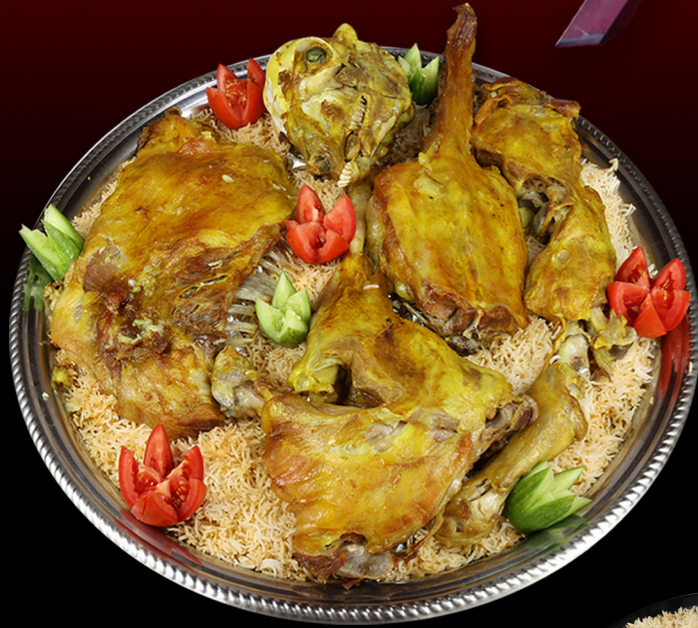
نصف ذبيحة مندي Half Mutton Mandi 380.00