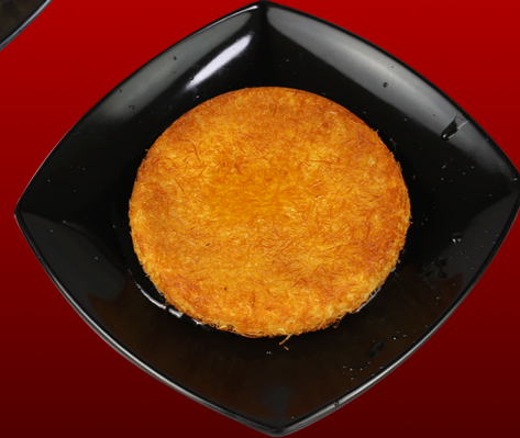
كنافه Kunafa 15.00