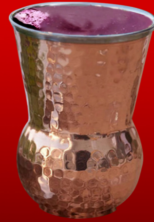
عصير زبيب Raisin Juice 12.00