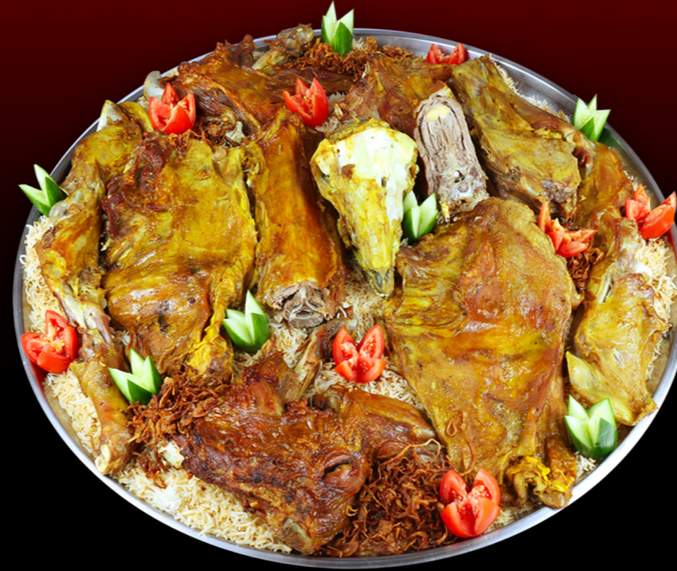
ذبيحة كامله مندي Whole Mutton Mandi 750.00