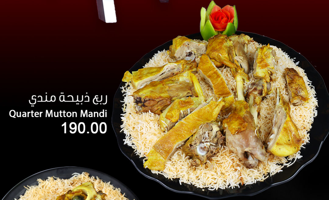
ربع ذبيحة مندي Quarter Mutton Mandi 190.00