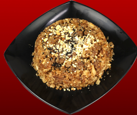
فتة تمر Fatta Dates 20.00