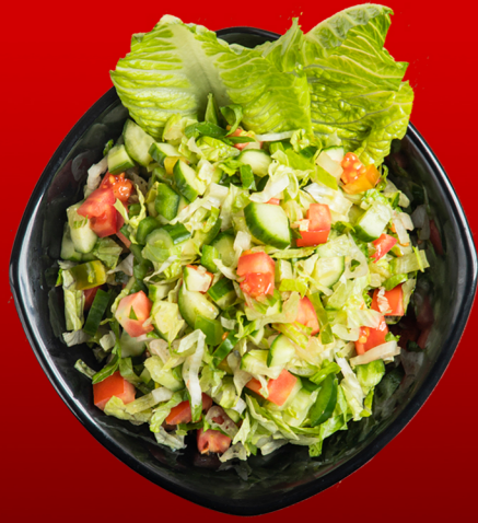
سلطة عربية Arabic Salad 12.00