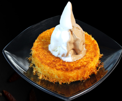
كنافه بالآيس كريم Kunafa with ice cream 20.00