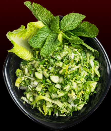
سلطة خضراء Green Salad 12.00