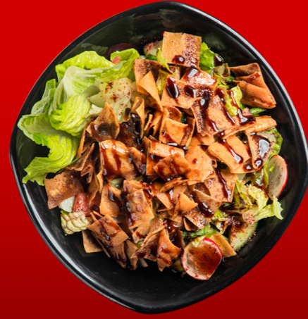
فتوش Fattoush 15.00