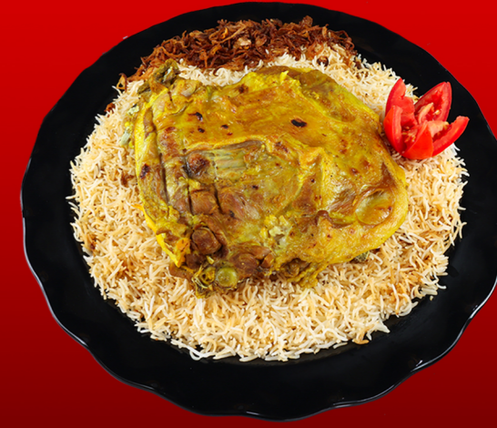
لحم حنيذ تعزي (جنب) Mutton Haneeth Taizy Ribs 75.00 - 🌶️ 80.00