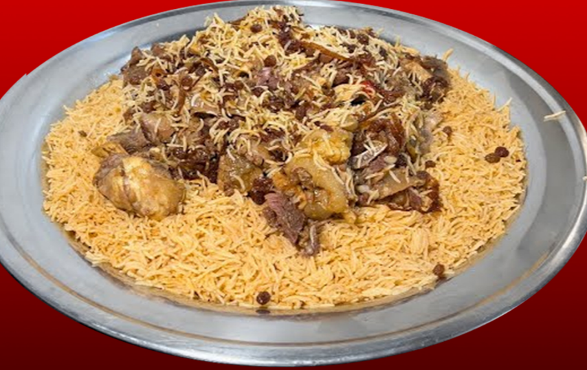
لحم حاشي طازج (مقلقل/بُرمة) Fresh Local Camel (Muqalqal / Burma) 75.00