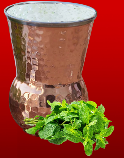
لبن عيران Laban Ayran 9.00