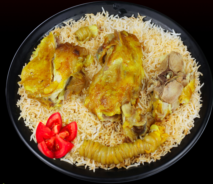
لحم مندي بلدي Fresh Mutton Mandi 80.00